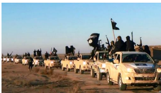
داعش با تصرف موصل مجهز شد

عراق بمائیه مرکز قدرتمند عرب در زمان صدام حسین جنگ خونین و طولانی را با کشور ایران از سر گذرانده بود. صدام همواره ادعای رهبری کشورهای عربی را داشت و خیال اتحاد عرب و پان عربیسم را در سر می پروراند؛ اما کشورهای عربی خلیج خاصه عربستان سعودی هرچند رقیب ایران محسوب می شدند، لیکن از عراق نیرومند می هراسیدند. طرح حمله سران ناتو (به رهبری امریکا و بریتانیا) به عراق در هماهنگی با کشورهای عرب بمیان آمد و رژیم صدام حسین با زور نظامی سرنگون شد. پروژه تبارز و قدرتمند شدن گروه جنایتکار داعش در عراق با همکاری مستقیم عربستان سعودی، ترکیه، کشورهای عرب و سران ناتو به رهبری ایالات متحده امریکا جامه عمل پوشید و از جانب ستون پنجم مزدور در درون اردو و دولت عراق عملاً حمایت گردید. سقوط شهر بزرگ موصل با نقشه از پیش طراحی شده به کمک مستقیم ستون پنجم و دسیسه خائنانه از درون دولت عراق بمیان آمد. در اثر سقوط شهر کلان موصل بزرگترین منابع مالی و تسلیحاتی به گروه داعش تسلیم داده شد. داعش پس از آن با سلاح سبک و سنگین، خودروهای نظامی فراوان و تجهیزات پیشرفته مجهز گردید. پس از تصرف موصل دامنه تجاوزات داعش به شکل حیرت انگیزی گسترش یافت.