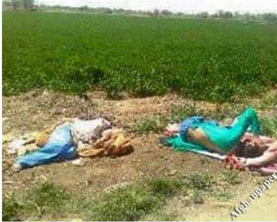
تجاوز به دختران تاجیک در کندوز