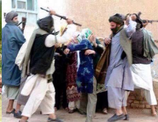
لت و کوب زنان توسط طالبان