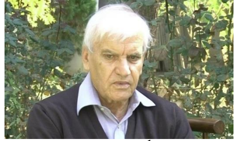
محمد امین فرهنگ

مجله شپیگل چاپ آلمان بر وزیر تجارت سابق محمد امین فرهنگ اتهام وارد کرده است که وی در وقت وزارت خود به ملیون ها دالر سرمایه دولتی دستبرد زده و این پول ها را در بانک های خارجی مخصوصاً در یک بانک سوئیس انتقال داده است. مجله شپیگل می نویسد: