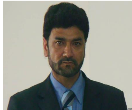
جنرال ظاهر اغبر (ظابط ظاهر)

شبنامه در کابل بخصوص دشت برچی نمودند. این اطلاعاتی ها هم کار به جای نبرد چون که آب خنک روی دست اش ریخته شده بودند.